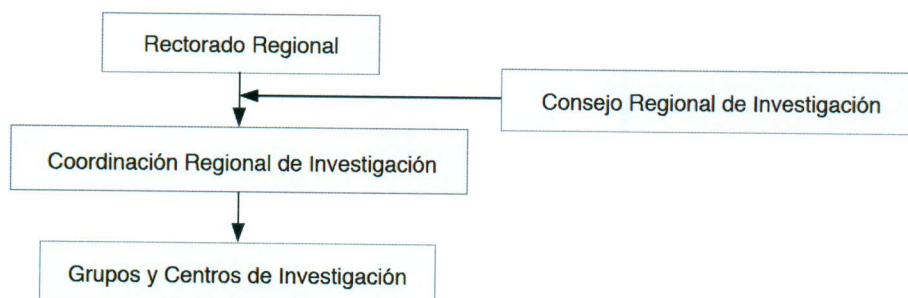
Figura 2. Esquema de organización de la Investigación a nivel regional.

Artículo 10. La conformación del Consejo Nacional de Investigación es la siguiente: